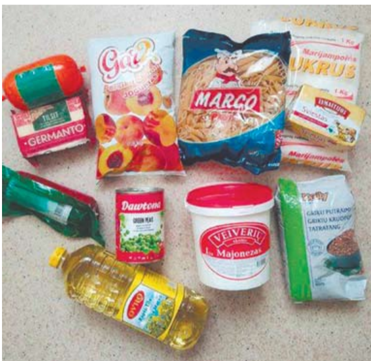
Anykščių Antano Vienuolio progimnazijos pradinukui skirto maisto daavinio sudėtis papiktino mamą.

Robertas ALEKSIEJŪNAS robertas.a@anyksta.lt