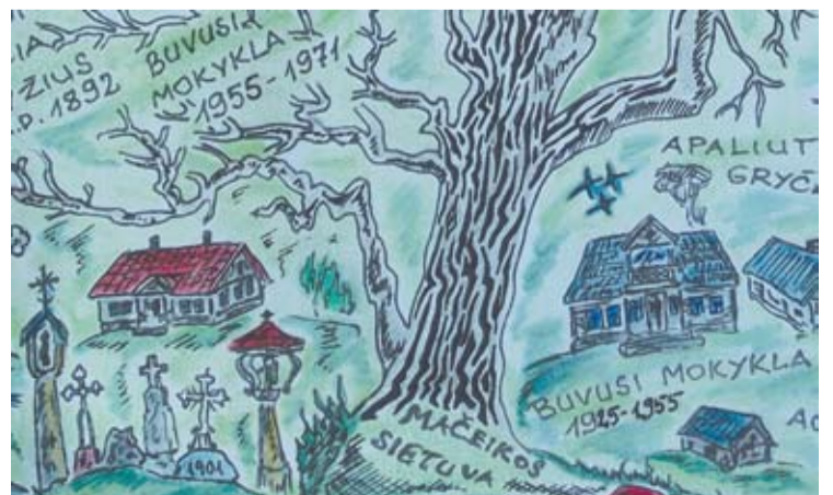
Jubiliejinėje atvirutėje, išleistoje pirmojo Butėnų kaimo paminėjimo istoriniuose šaltiniuose 350 metų proga, pažymėtos ir abi sodžiaus mokyklos.

Buvo laikas, kai sodžius viltingai budo, aktyvėjo visuomeninis gyvenimas, turtingesni sodiečiai puoselėjo viltį tą seną pajuodusį rūmą bendruomenės namams nupirkti. Tik dėl kainos nesulygo, mat labai brangi Prūsų palikuonims ta vieta, prie jos taip kaip kadaise senelis Damijonas prisirišę. Butėnai jiems tebėra brangūs. Gal ir gerai, kad taip pasibaigė, nes tuo metu plačiai užsimojus trobesys būtų buvęs rekonstruotas, pakeistas neatpažįstamai. O gal ir blogai, nes nežinia, koks dabar bus to istorinio rūmo likimas. Šimtmečio proga esame sumanę ant jo sienos pritvirtinti atminties lentelę, primenančią, kad šiame Augustino Žvirblio name buvo tarpukario Lietuvos kultūros židinyje bei tautos kultūros šventovė – mokykla.