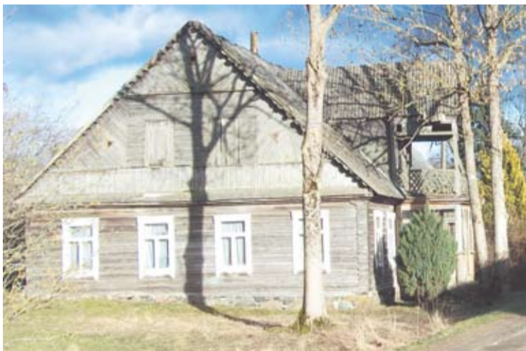
Tikriausia Butėnų kaimo puošmena – daugiau nei prieš šimtą metų statytas Prūsos namas.

Praėjusio amžiaus pradžioje didysis namas sudegė, bet buvo atstatytas apie 1916 metus, tarpukariu parduotas, naujų šeiminkų nuomotas – daugelį metų čia veikė mokykla, name gyveno ir mokytojai, pokariu veikė klubas – skaitykla, o dabar jis stovi tuščias. Paslaptingas, pajuodęs, truputį apleistas, tačiau žavus šimtamečiu modernios trobos stiliumi ir savąja istorijos pasaka.